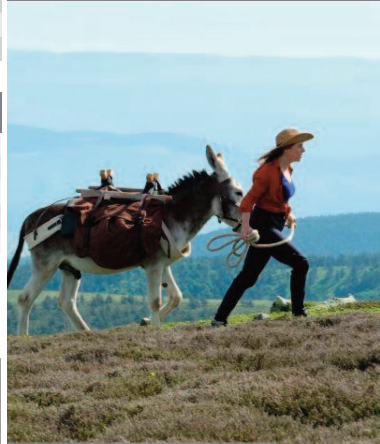
ANTOINETTE DANS LES CEVENNES de CAROLINE VIGNAL